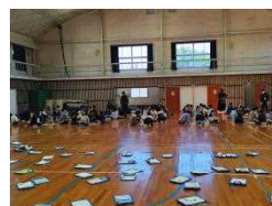
初挑戦 牧水 かるた