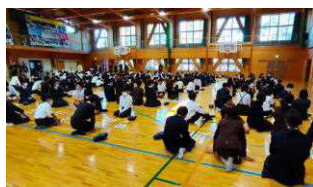
交流 牧水 かるた