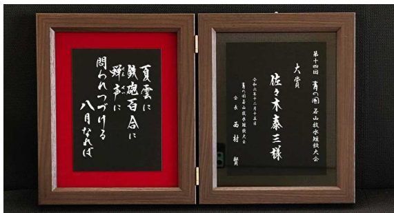
大賞と各部門優良賞以上に贈られた楯 左側には、受賞作品を印字しています