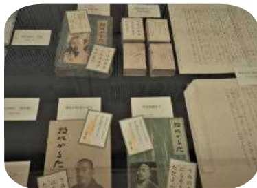
牧水かるたの変遷

約 9,000 首と言われる牧水短歌から 100 首に絞られるまでの選歌過程を直筆選歌資料とともに解説しています。