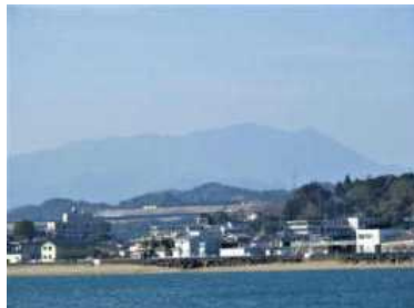
門川町海浜公園から臨む