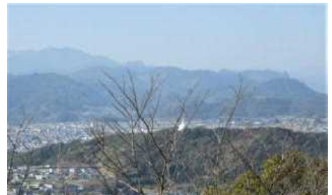
日向市米ノ山展望台から臨む