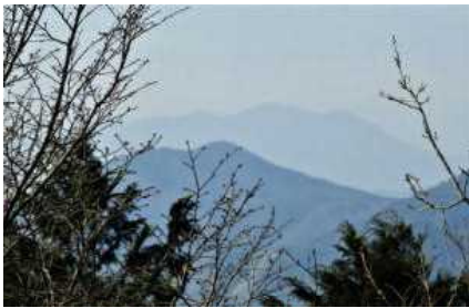
延岡市愛宕山山頂から臨む

ある日、こんなことを想像してみました。 牧水先生が 120 年前に見たであろう延岡から見る尾鈴はどのように見えるのだろう、坪谷に帰る途中で見る尾鈴は・・・、坪谷で見る尾鈴は・・・と。 そして先日、尾鈴山めぐりに出かけてきました。