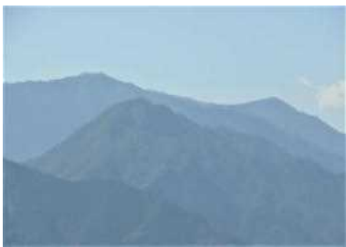
東郷メディキット第二工場 グラウンドから臨む (日向市東郷町)